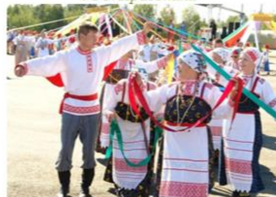
№ 3. Праздники

КОМИ- ПЕРМЯЦКО- РУССКОЙ СЛОВАРЬ КОМИ- ПЕРМЯЦКО- РУССКИЙ СЛОВАРЬ