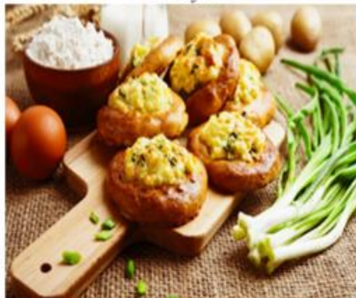
№ 1. Кухня