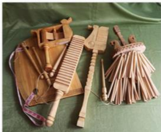
№1. Музыкальные инструменты