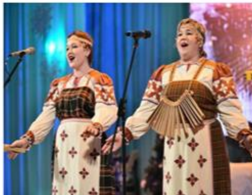
№ 2. Песни