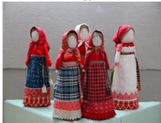
№ 1. Игрушки