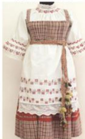
№ 2. Одежда